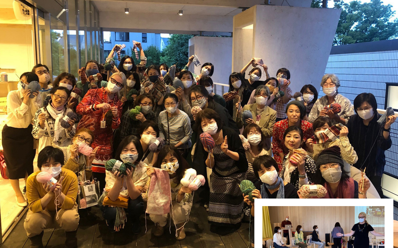
Knitting Club keräsi syksyllä runsaasti neuloja Metsä-paviljonkiin.