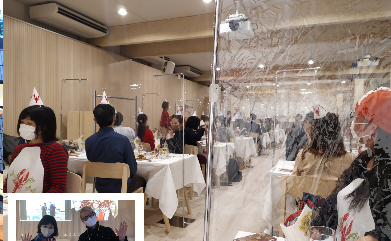
Suomen Japanin instituutin perinteisiä rapujuhlia vietettiin Metsä-paviljongissa, Kuva: SJI