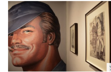
渋谷パルコの「GALLERY X」で開かれているトム・オブ・フィンランドの個展。貴重な原画が飾られている＝東京都渋谷区で2020年9月17日

同性愛に偏見の目が向けられていた時代に、官能的に描かれた筋肉質な男性たち――。北欧・フィンランドで、ゲイの男性の開放的な姿を描いた画家「トム・オブ・フィンランド」ことトウコ・ラークソネン(1920～91)。彼の生誕100周年を記念する日本で初めての個展が東京・渋谷パルコの「GALLERY X」で開かれている。共催したのは日本国内で学術や文化にまつわる活動をするフィンランドセンターと在日フィンランド大使館、パルコ、TOM OF FINLAND財団など。46～89年