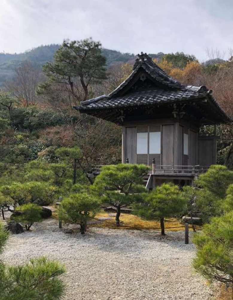
Instituutti aloitti uuden tutkimusprojektin japanilaisista Sansou-kodeista ja suomalaisista taiteilijakodeista yhteistyössä Wasedan yliopiston kanssa.