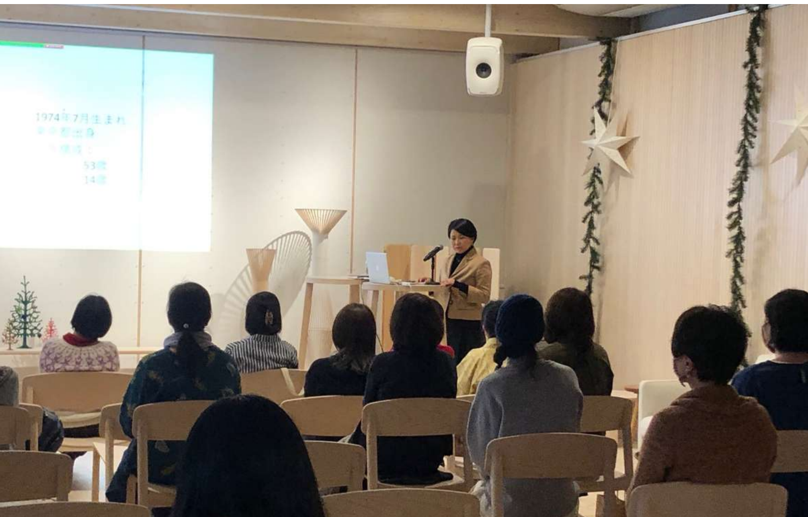
Innokkaita kuulijoita Women: STOP dreaming – start acting -seminaarissa Metsä-paviljongissa