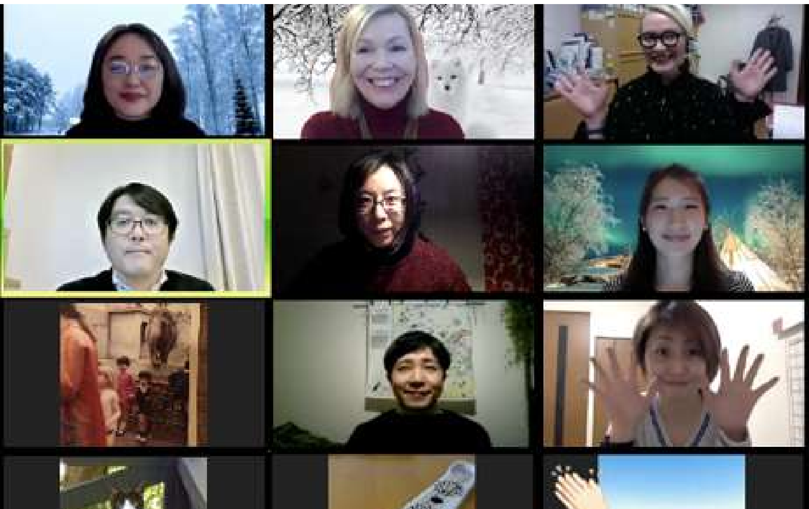
MIELI Suomen Mielenterveys ry:n ja Asahi Travel International Inc.:n kanssa yhteistyössä järjestetty Mental health -seminaari pidettiin verkossa.