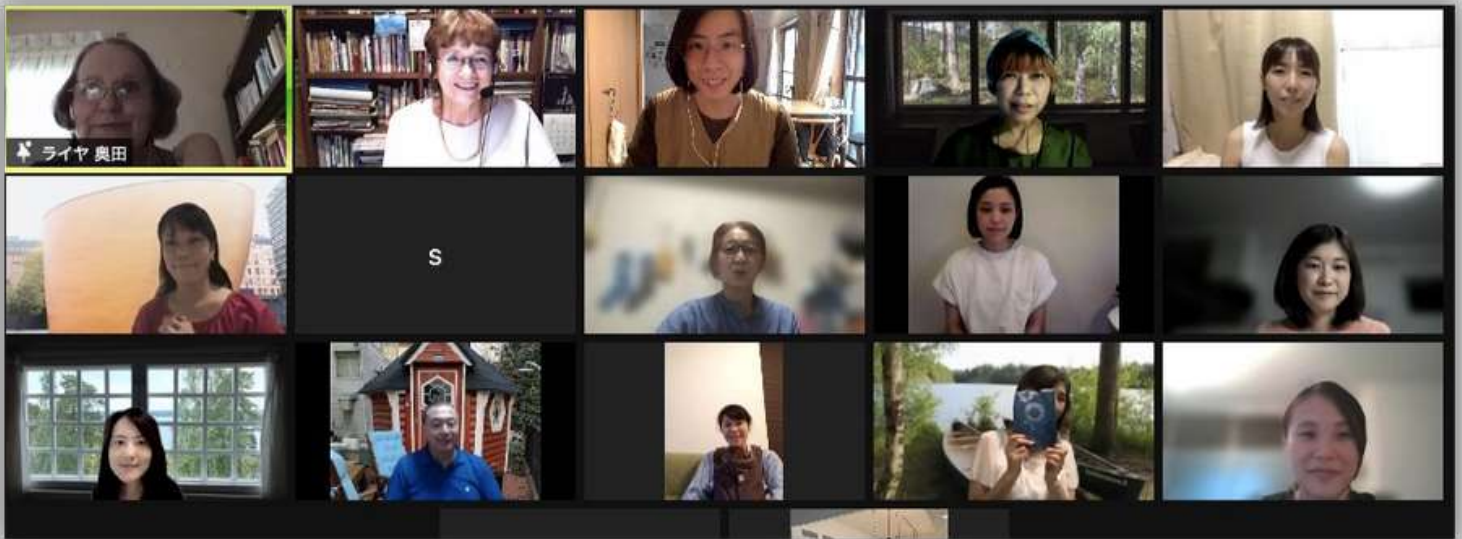
Yllä: Artikkeleita Liikkuva koulu -hankkeesta Yomiuri Shinbun -sanomalehdessä. (Kuva: SJI) Alla: Suomen kielen kurssit jatkuivat verkossa. (Kuva: SJI)