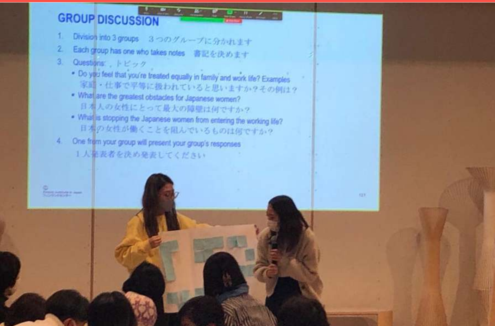
Nordic Talks -seminaari järjestettiin yhteistyössä pohjoismaisten suurlähetystöjen kanssa Metsä-paviljongissa.