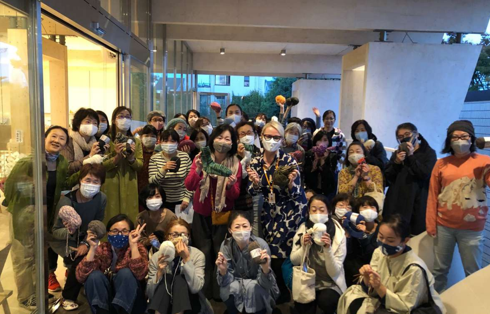
Viisituntinen neulontamaraton järjestettiin huhtikuussa hybriditapahtumana Metsä-paviljongissa.