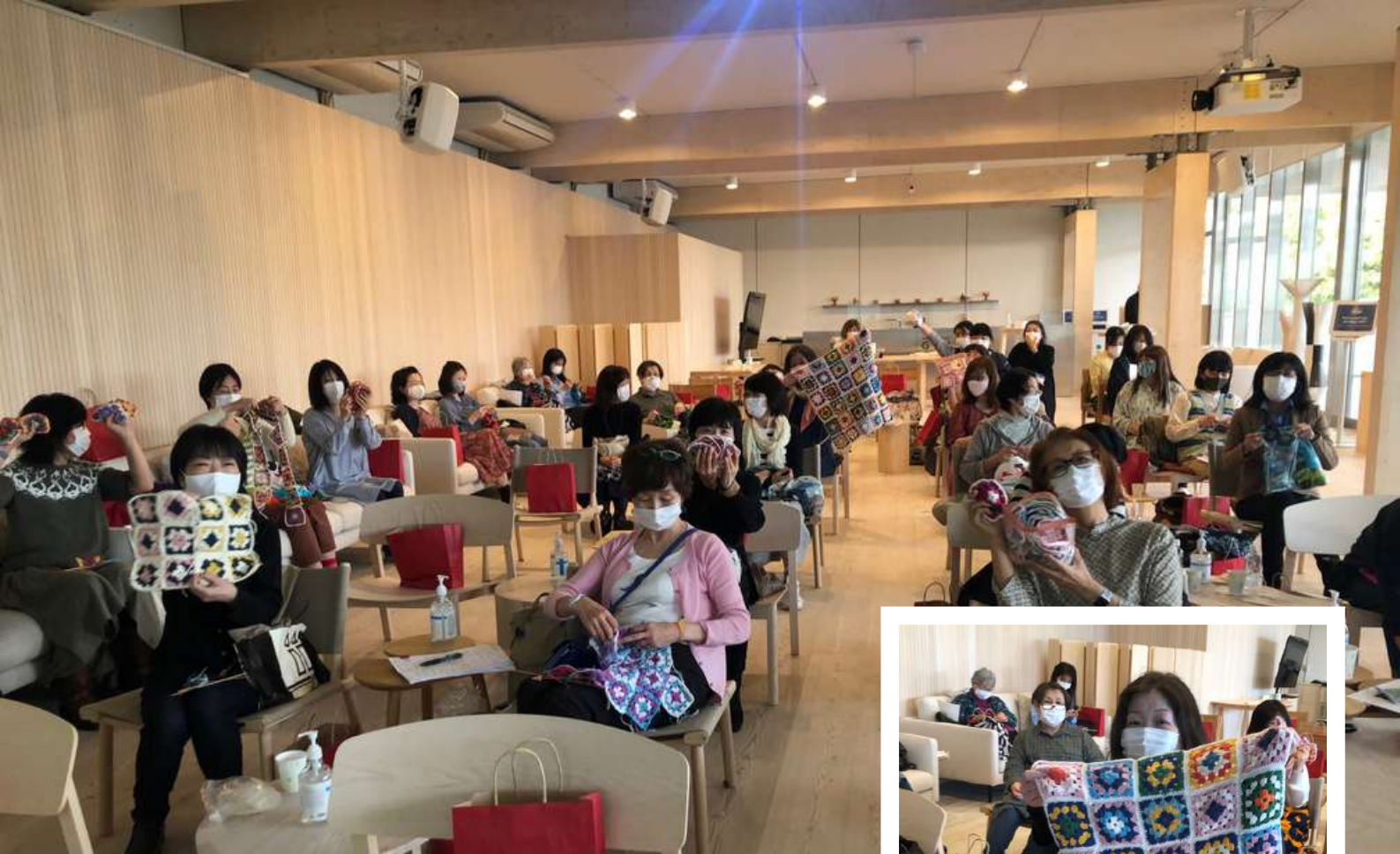
Knitting Club -neulontamaraton Metsä-paviljongissa.