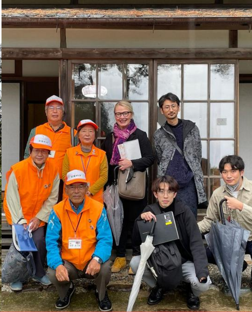
The Finnish Artists' Colonies villas and the Japanese Sansou in the modern age – their similarities through the lense of National Romanticism and togetherness with nature -tutkimusryhmä vierailmassa Rokkokudo-sansoulla Ibarakissa.