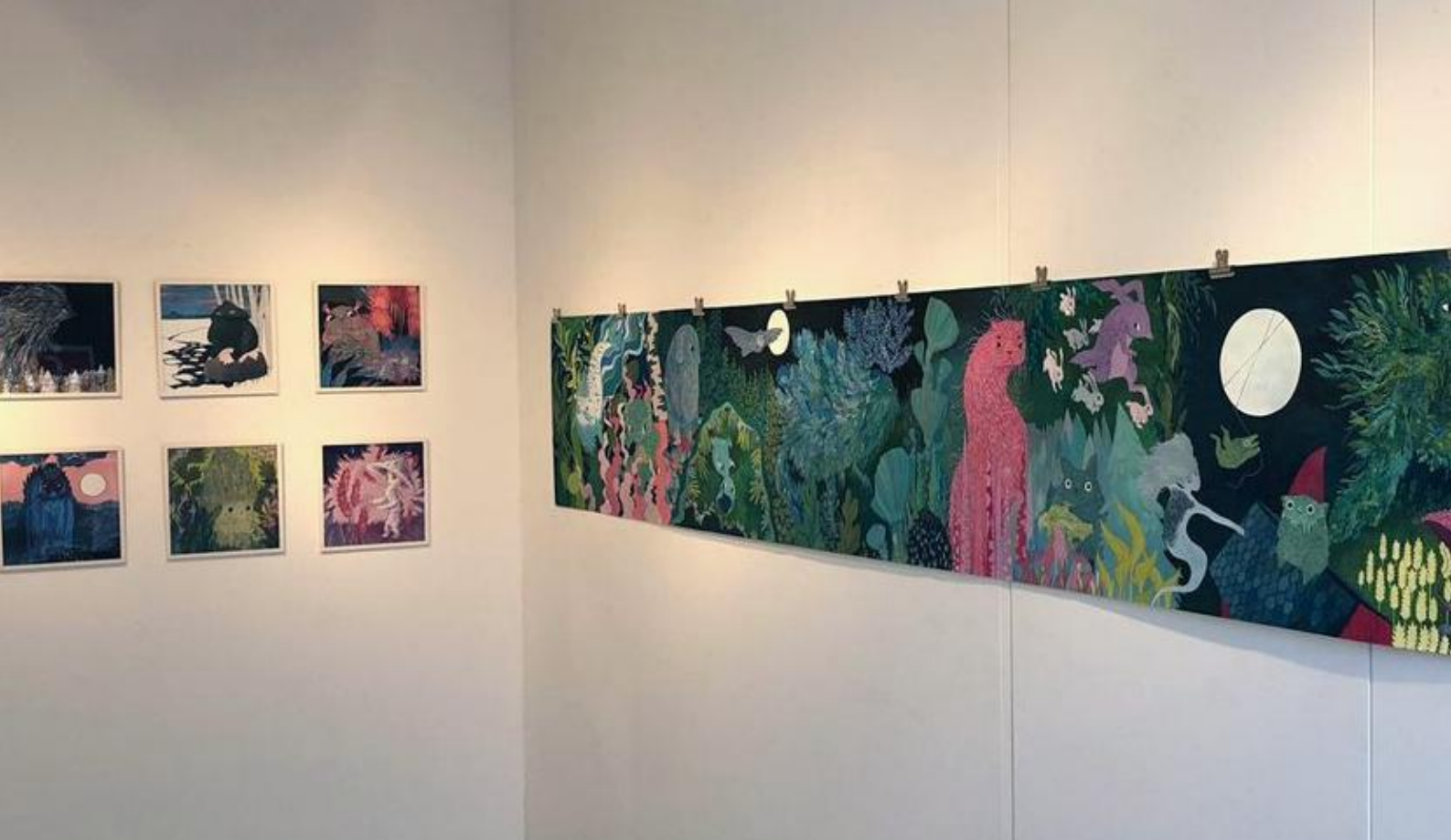
Yllä: Kuva Miila Westinin Mythical -näyttelyn teoksista.