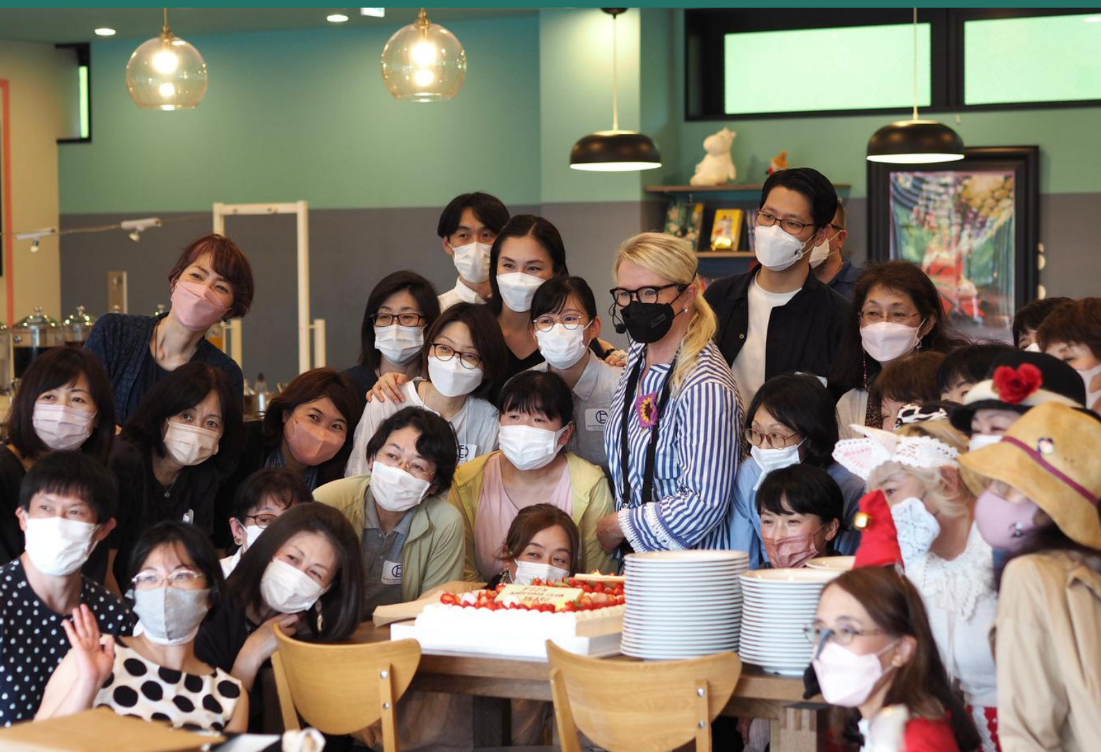
Knitting Club -ompeluseuran kokoontuminen syntymäpäivän kunniaksi.