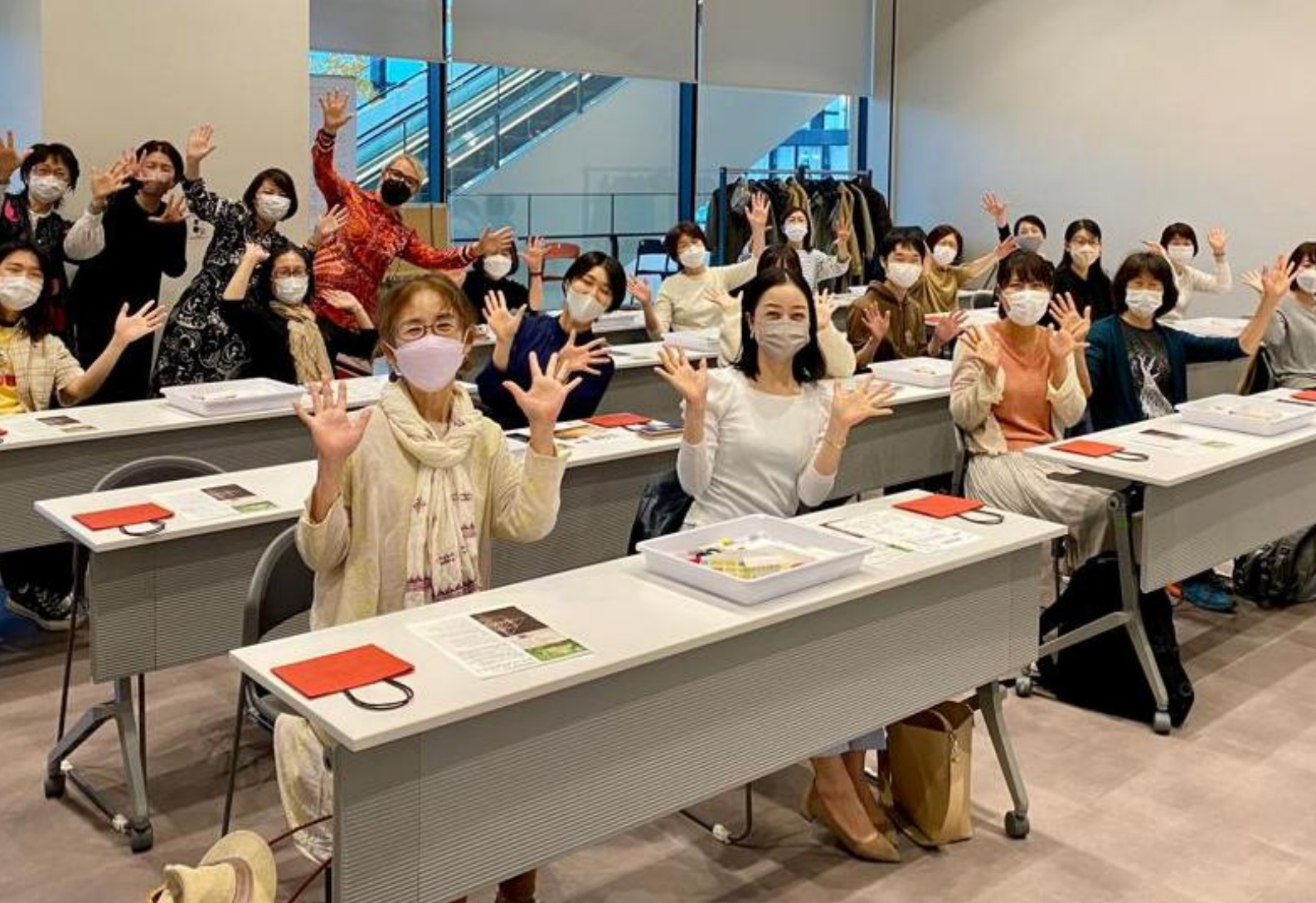
Hokkaido Finland Week työpajan osallistujia.