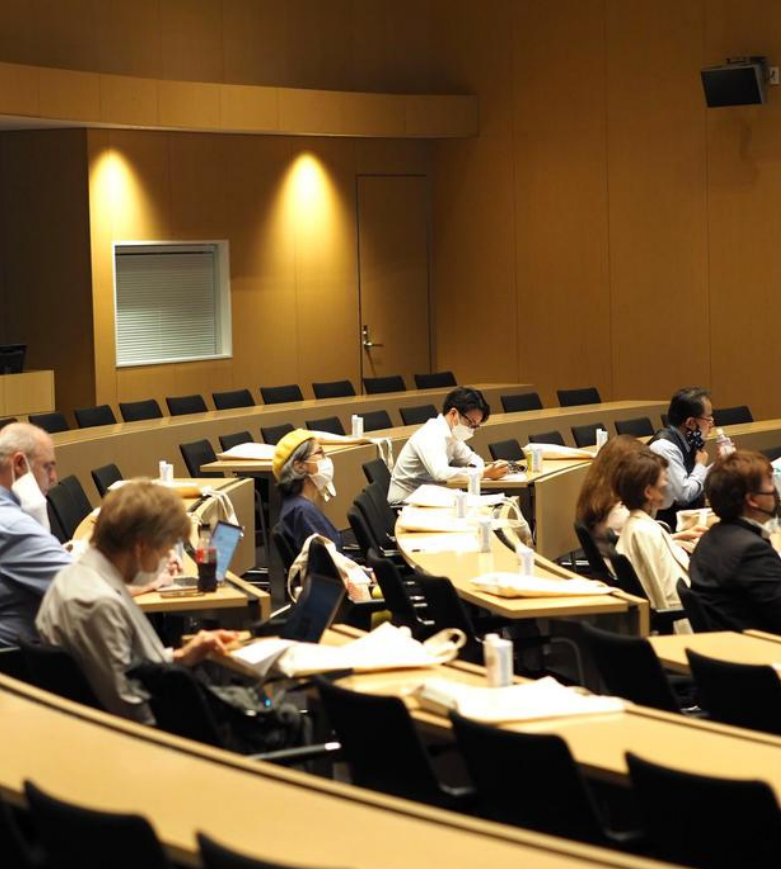
AI to Assist the Aging Society – A Challenge or A Possibility? seminaari.