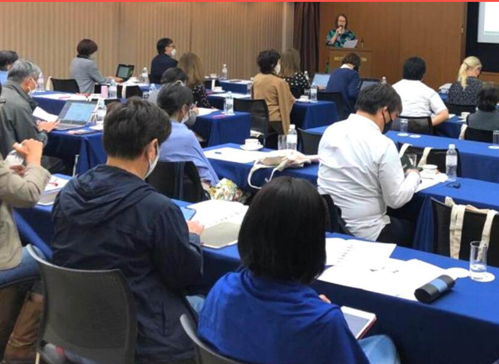
Creative Aging: Approaches to cultural participation in later life -seminaarin kiinnostuneita osallistujia.