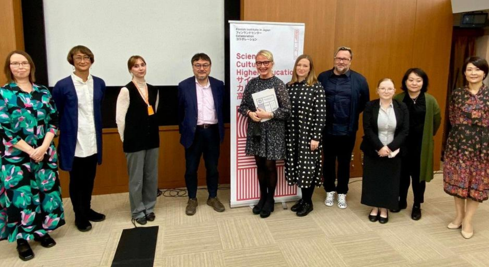
Creative Aging: Approaches to cultural participation in later life -seminaarin puhujat sekä instituutin henkilökuntaa.